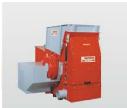
Baureihe AZR 600 K - 2000 K S Gigant: der Einwellenzerkleinerer für die effektive Kunststoffzerkleinerung