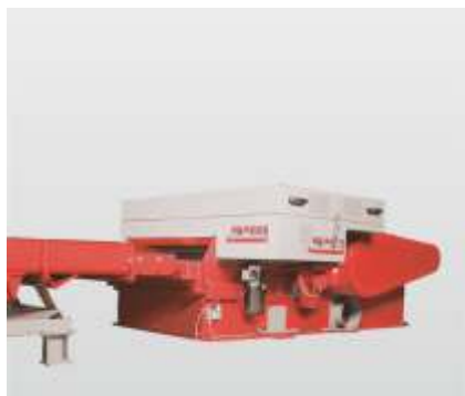
Baureihe RLZ 400 - RHZ 1300 S: der Horizontalzerkleinerer für die horizontale Beschickung der Maschine