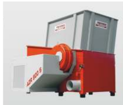
Baureihe AZR 800 - 2000 S Gigant: der Einwellenzerkleinerer für die professionelle Zerkleinerung