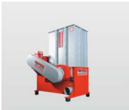
Baureihe AZR 50 Primus: das Einstiegsmodell in die Zerkleinerungstechnik mit Schubladenvorschub