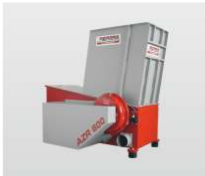
Baureihe AZR 600 - AZR 600 S: der Universalzerkleinerer für Schreinereien