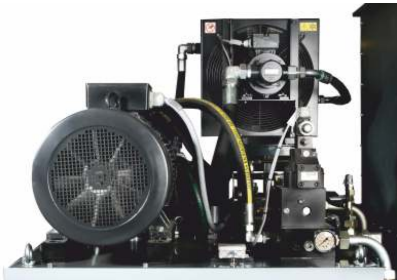
Hydraulikaggregat mit Axialkolbenpumpe und Kühlung für den Mehrschichtbetrieb