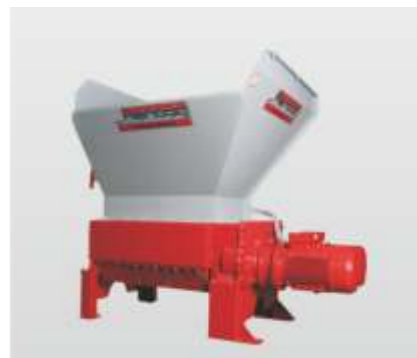
Baureihe RMZ 500 - RMZ 1000 S: der Vierwellenzerkleinerer, ideal zum Zerkleinern von langen Teilen

Durch die langjährige Erfahrung in der Wertstoffzerkleinerung und Brikettierung kann Reinbold mit seinem umfangreichen Maschinenprogramm optimale Lösungen für die verschiedensten Anwendungen in der Zerkleinerung und Brikettierung bieten. Für Versuche mit Ihrem Material steht Ihnen unser Technikum zur Verfügung.