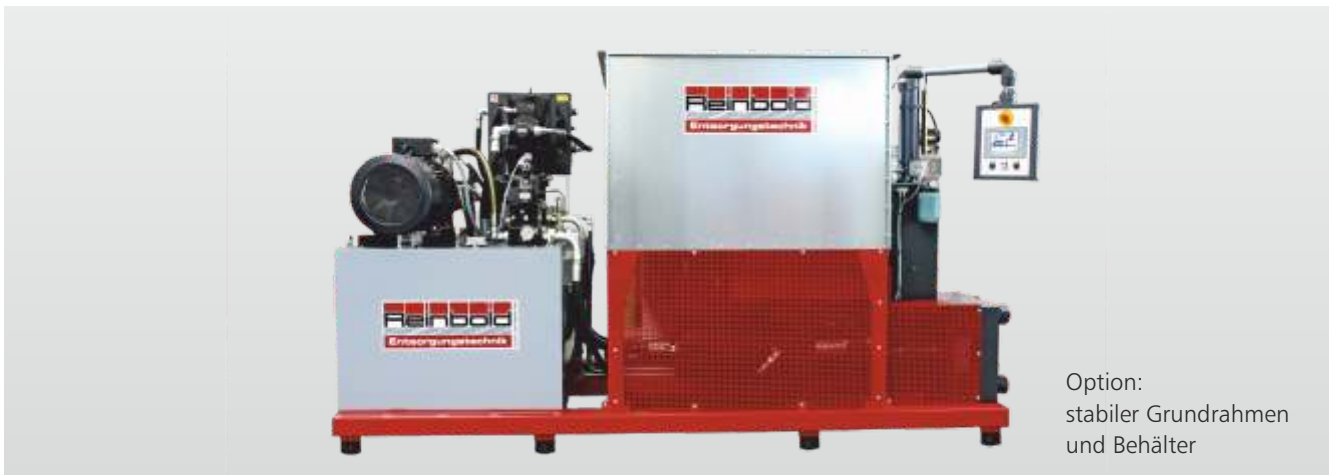
Option: stabiler Grundrahmen und Behälter